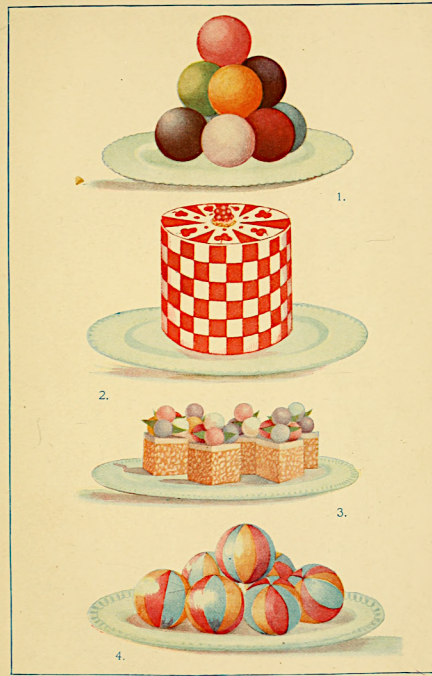
1. Ballettes à la Billard. 2. Chartreuse à la Reine. 3. Petits Gateaux à l'Elysee. 4. Ballettes à la Joujou.