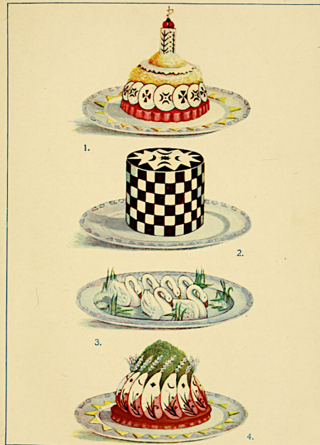
1. Medallions of Chicken à la Audrey. 2. Chartreuse à l'Echec. 3. Swans à la Henley. 4. Cutlets à la General.