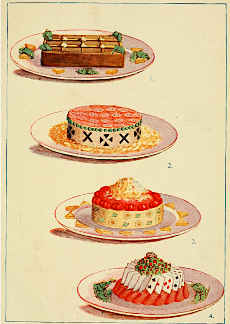
1. Pressed Beef à la Cornwall. 2. Boudin à la Kaiser. 3. Chartreuse à la Alexandra. 4. Chaudfroid à la Homburg.