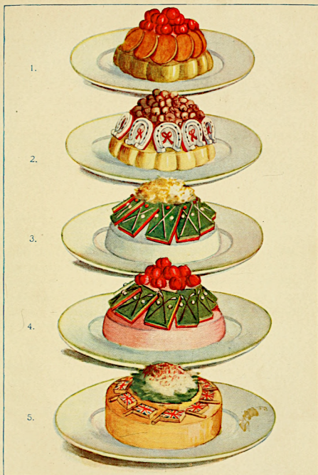
1. Pork Cutlets à la Berlin. 2. Crème de Veau "Porte Veine." 3. Crème de Lapin "100 up." 4. Mousse de Volaille St. Andrew. 5. Lobster à la United Service.