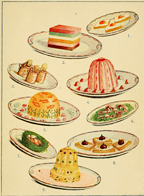
1. Sweet Poached Eggs. 2. Neapolitan Cream. 3. Jugged Hare à la Surprise. 4. Rhubarb Jelly and Banana Cream. 5. Ocean Flowers. 6. Surprise Mushrooms. 7. Eggs en Surprise. 8. Rognons à la Curcio. 9. Macedon Jelly.